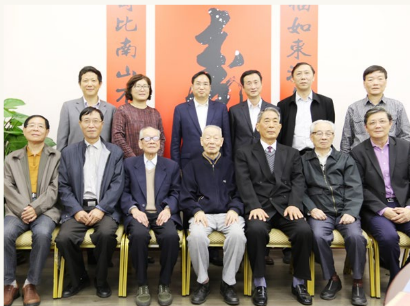
集团老干部中心为70岁、80岁以上“逢五”“逢十” 离退休干部举行重阳节集体祝寿活动。