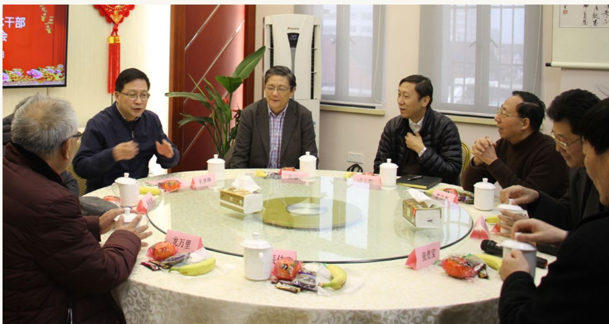
2017年离退休干部迎春团拜会。