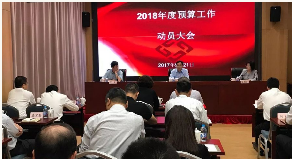
2018年度预算工作动员大会。