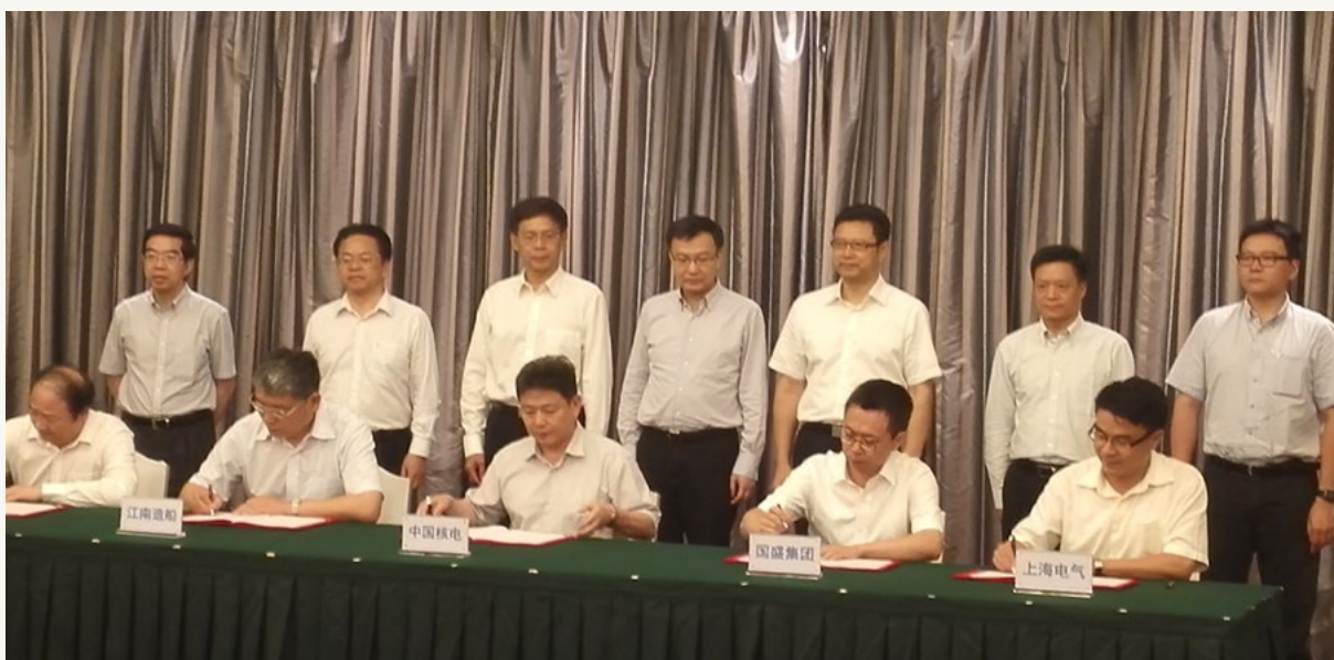
中国海洋核动力发展有限公司领导小组第一次会议暨 投资协议签约仪式在衡山宾馆举行。