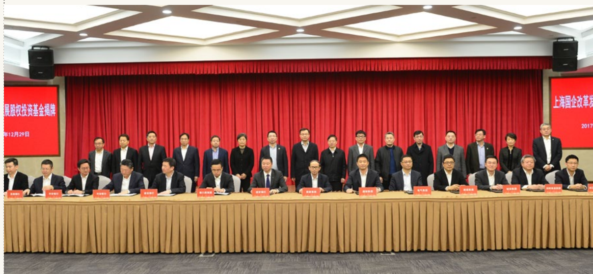
12月29日 星期五 ● 上海国企改革发展股权投资基金及其管理公司（上海国盛资本管理有限公司）顺利揭牌。