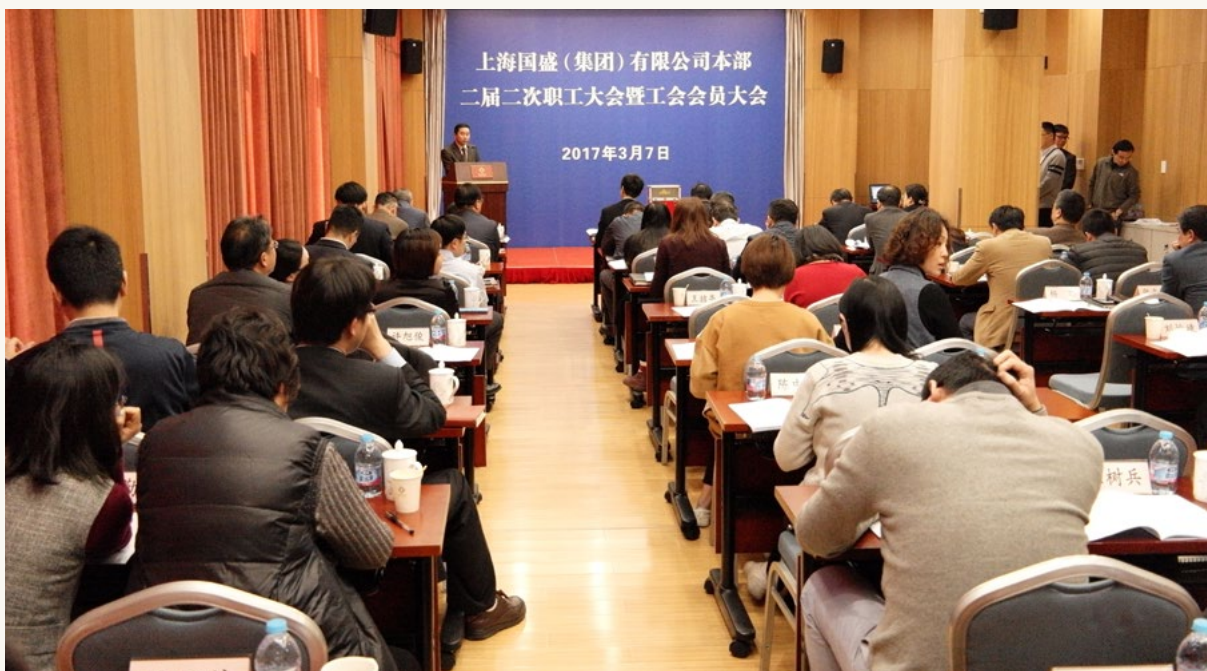
集团本部二届二次职工大会暨工会会员大会。