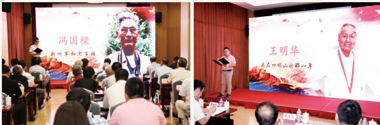
8月4日 星期五 集团举办“红色故事伴我成长”集团庆祝建军90周年活动。