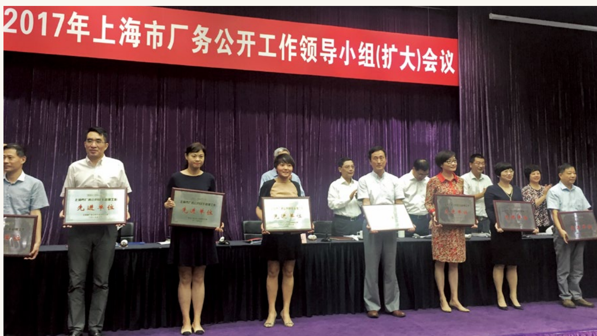
集团荣获2015—2016年度市厂务公开民主管理工作 先进单位。