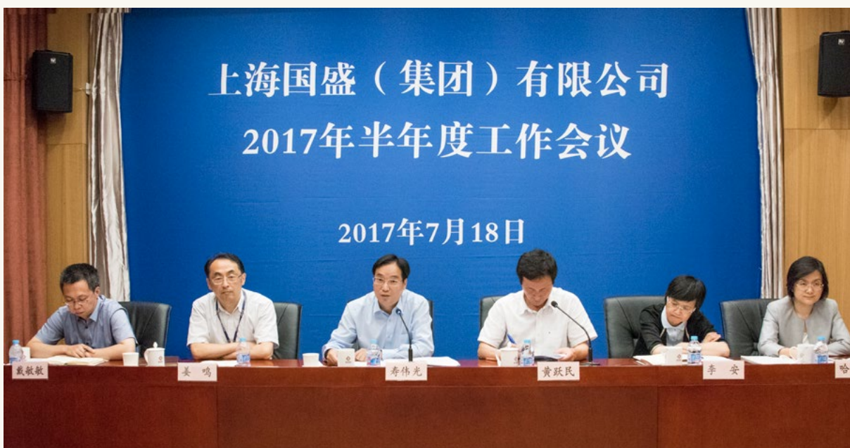
2017年半年度工作会议。