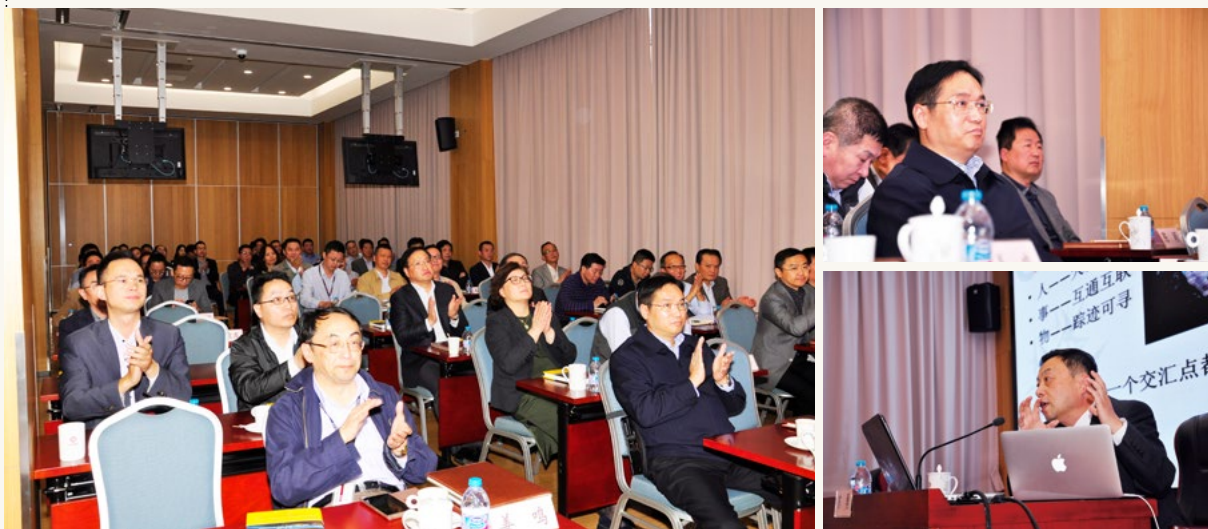
10月25日 星期三 ● 集团举办专题学习讲座《互联网时代的中国企业变革》，由复旦大学管理学院教授、企业管理系主任、东方管理学院院长、博士生导师苏勇主讲。