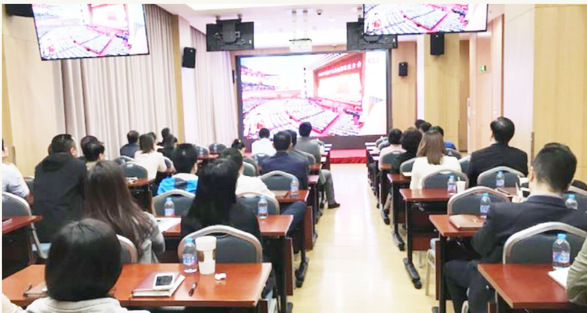
10月18日 星期三 ● 集团以党支部为单位，组织党员集中收看党的十九大开幕实况。