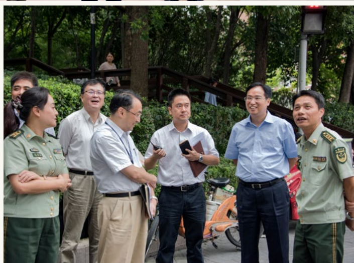
集团2017年消防应急疏散演练。